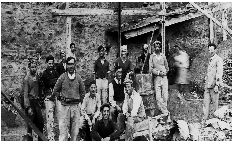
Foto 1 - Operai italiani di un cantiere edile in Algeria all’inizio degli anni ‘30